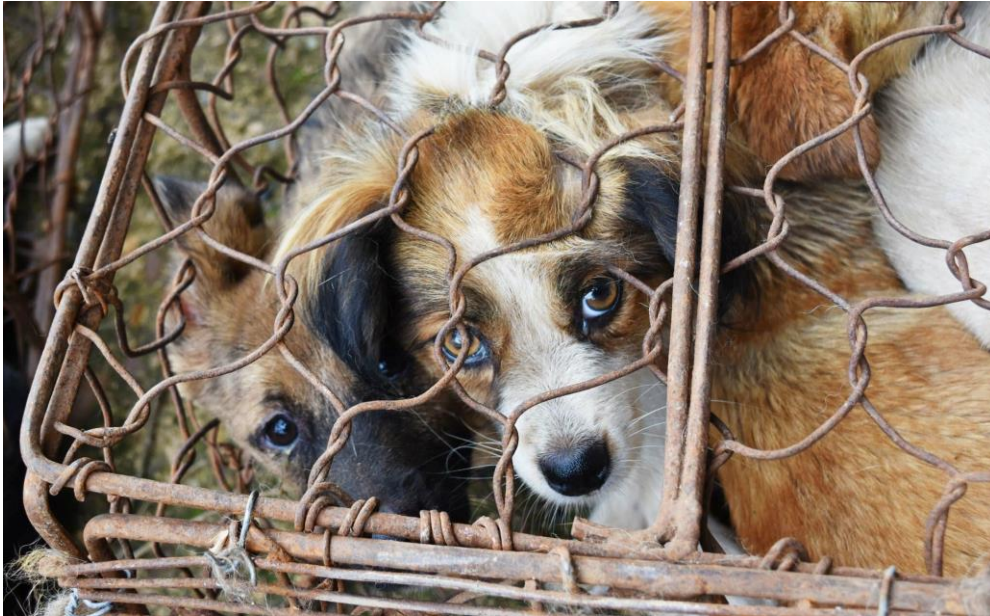
Honden in Europa en Azië

Honden en katten beschouwen wij in Nederland als onze vrienden, helaas is dit in Azië niet de realiteit. Miljoenen honden en katten worden jaarlijks op een gruwelijke wijze afgeslacht om vervolgens geconsumeerd te worden of de vacht wordt vaak ook in bont producten verwerkt. Niet alleen in Azië gebeuren er gruweligheden met de honden en katten maar ook in Europa.